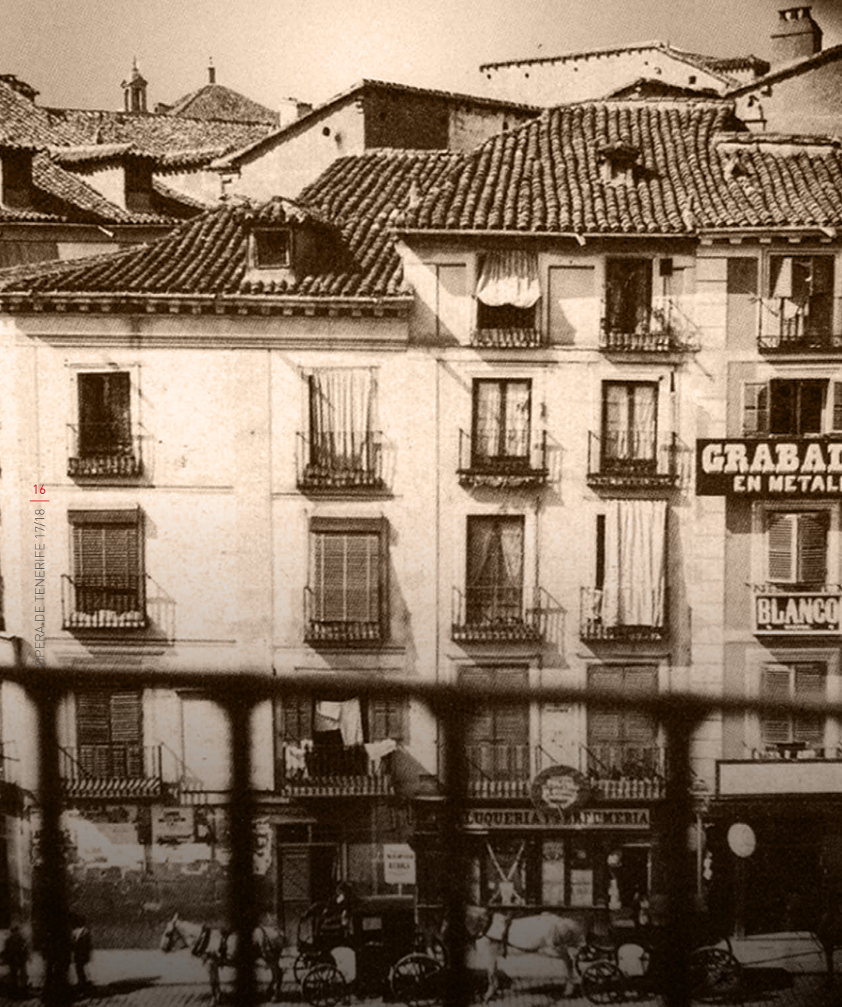
Puerta del Sol, antes de la reforma 1855