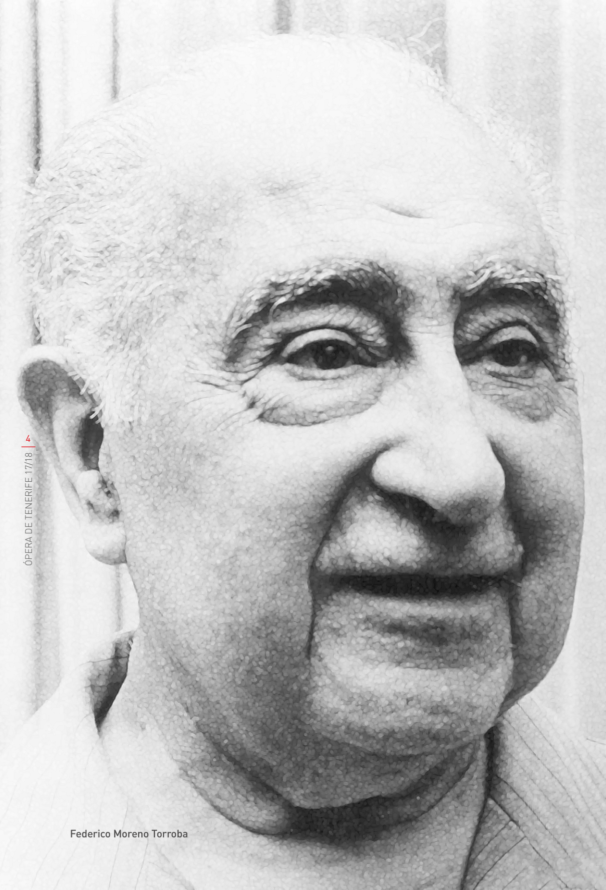
Federico Moreno Torroba